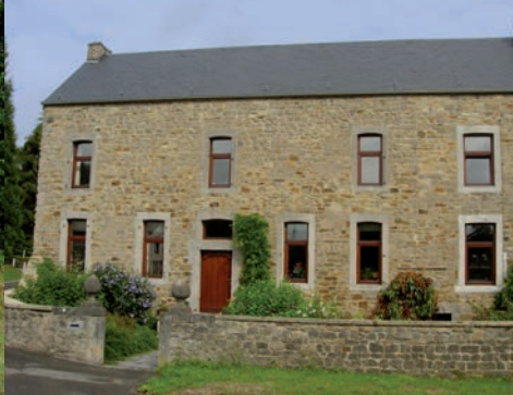
Chapelle Sainte Barbe